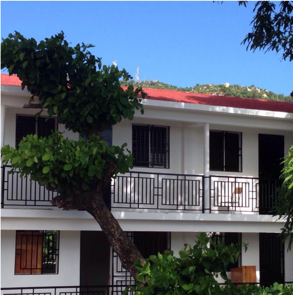
Le local flambant neuf de la FDSEG du Cap-Haïtien

chargées de planifier et d'organiser cette festivité à laquelle ces derniers souhaitent donner un caractère national.