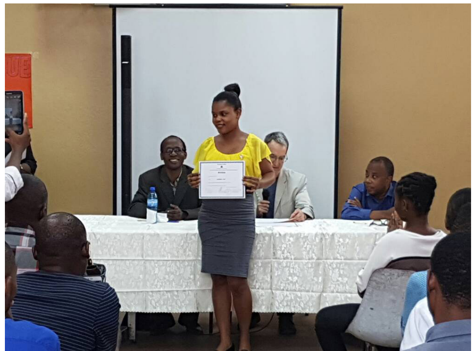
Une participante pose avec son certificat

Une telle initiative entre dans le cadre de la mission de l'UEH de se positionner sur les grandes questions de société tout en indiquant des pistes de solution aux décideurs, selon le bureau du Vice-recteur aux