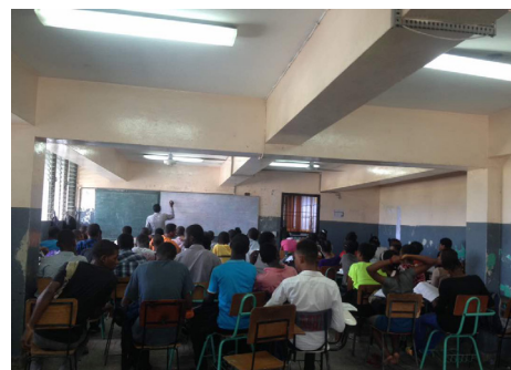
Une vue de l'assistance lors du préfac à l'INAGHEI

Une préfac gratuite a débuté le lundi 24 juillet 2017 à l'Institut National d'Administration, de Gestion et des Hautes Etudes Internationales (INAGHEI). Il s'agit d'une initiative du Comité des étudiants de l'INAGHEI. Ces cours de mise à niveau dont les inscriptions ont été lancées le 10 juillet dernier, sont dispensés dans une grande salle aménagée à cet effet. Plus d'une centaine de participants venant tout juste de la terminale ont été sélectionnés à l'issue d'un concours d'admission organisé le