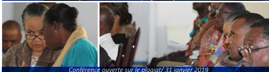
Conférence ouverte sur le plagiat/ 31 janvier 2019