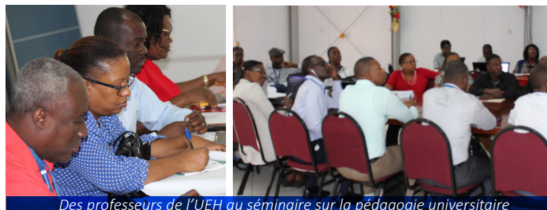
Des professeurs de l'UEH au séminaire sur la pédagogie universitaire