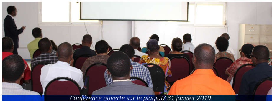
Conférence ouverte sur le plagiat/ 31 janvier 2019